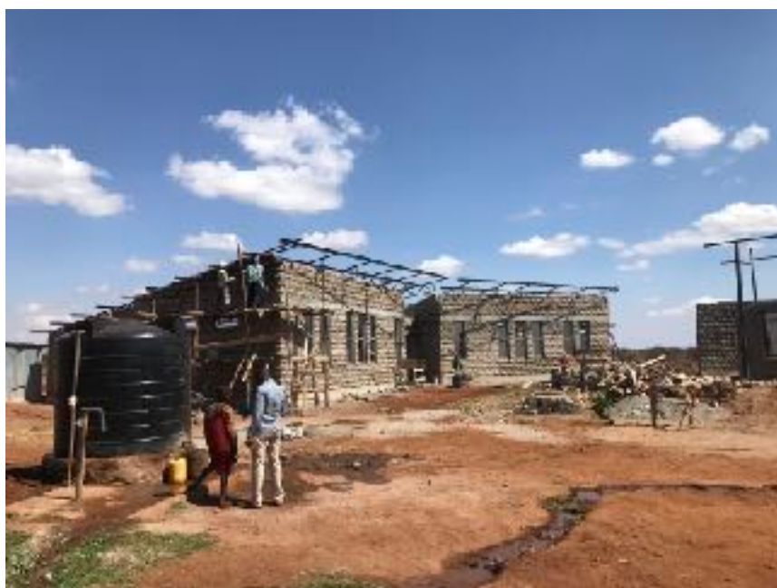
De Girls Academy in aanbouw.