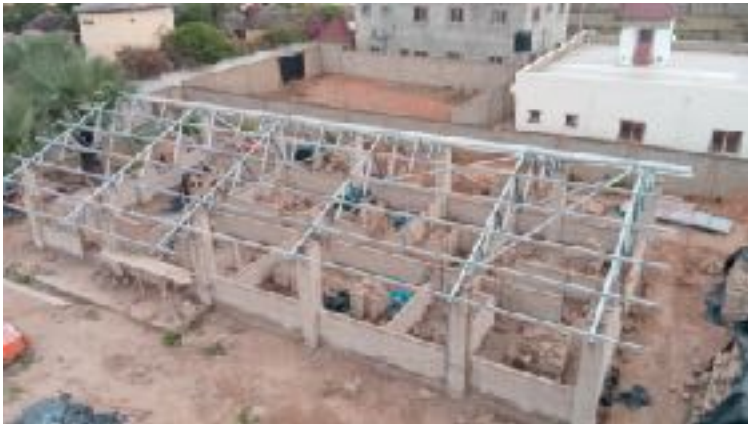
Nieuwbouw kantoor en personeelswoning Brufut.