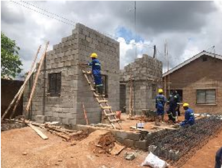
Covid-19 kliniek in aanbouw Limbe