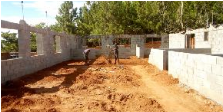
Rehabilitatie kliniek in aanbouw Mzuzu.