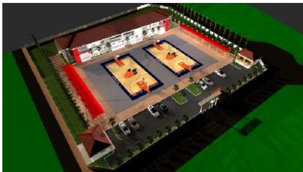
Het ontwerp van het Youth Center in Ghana.