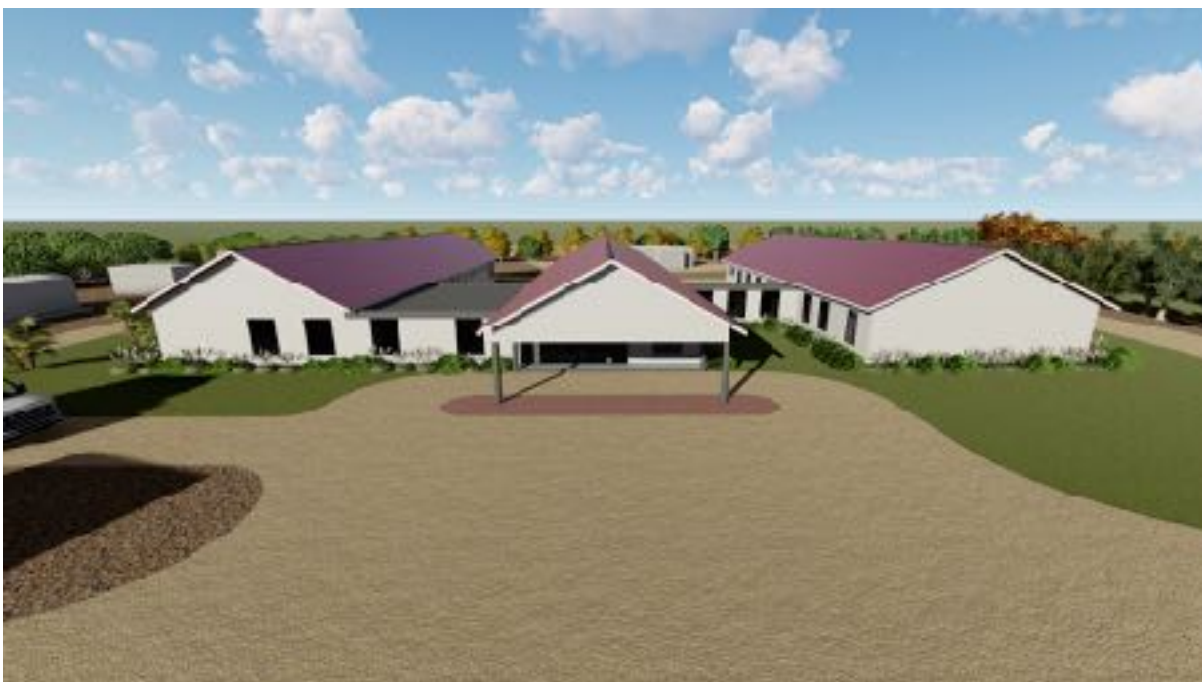
Ontwerp voor de maternity ward Lusangazi