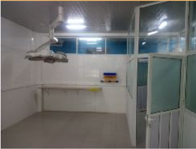
Renovatie OK afdeling Banjul.