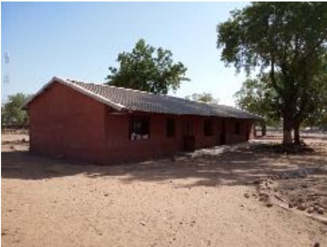
Renovatie kleuterschool Sami Pachonki