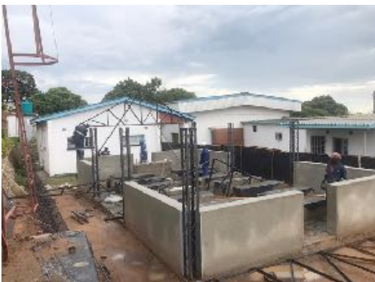
Covid-19 kliniek in aanbouw Ndirande